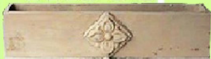
Lisa c/ Applique